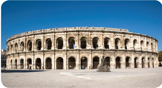
Les Arènes de Nîmes

Des monuments : le musée du Louvre, les Arènes de Nîmes, le Panthéon, l'église de Notre-Dame, le Château de Chambord.