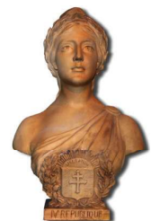
le buste de Marianne

Des parfumeurs : Chanel, Guerlain, Lanvin, Patou.