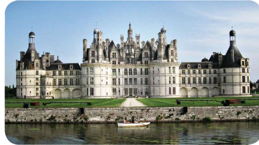
Le Château de Chambord

La devise de la République : Liberté, égalité, fraternité.