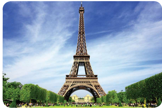
La Tour Eiffel

Des montagnes : les Alpes, les Pyrénées, le Jura, les Vosges et le Massif Central.